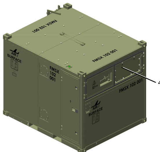
Bild 2. Utvändig vy, främre gavel/höger sida